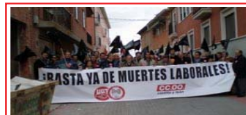
"El primer trimestre de 2007 se ha saldado con 7 muertos en el sector de la construcción, 4 más de los registrados en el mismo periodo del año anterior."

Desde CC.OO. abogamos porque exista un control más exhaustivo de las condiciones de trabajo en general, y las de los trabajadores inmigrantes en particular, puesto que a pesar de los pensamientos de algunos, os trabajadores inmigrantes son hoy en día una pieza muy importante en el engranaje de la economía española y castellano-leonesa.