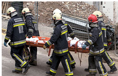
Momento en el que una de las víctimas del accidente múltiple del hotel de Mallorca era rescatada.

Acogiéndonos al desgraciadamente famoso “piensa mal y acertarás”, descubrimos que muchos de los accidentes que son calificados como leves y que por tanto aparecen como tal en las estadísticas, en realidad no lo son. Es decir, demasiadas empresas califican los accidentes de leves sin serlo con el único propósito de eludir las investigaciones y diligencias de la Autoridad Laboral, que en caso de accidente grave ocasionado por falta de medidas de seguridad, debe sancionar económicamente a la empresa y penalizarla con otra sería de consecuencias negativas que se tratan de evitar.