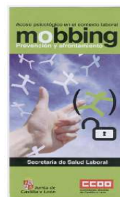
Diccionario informativo elaborado por la Secretaría en relación a este tema.

Sin embargo y pesar de las posibles carencias, no es menos cierto que se ha dado un paso adelante y que con la tipificación de acoso como delito se da respuesta a una realidad que afecta a muchos trabajadores y trabajadoras que hasta ahora han estado desprotegidos y con su entrada en vigor dará una efectiva respuesta y amparo judicial a las víctimas, o al menos eso esperamos.