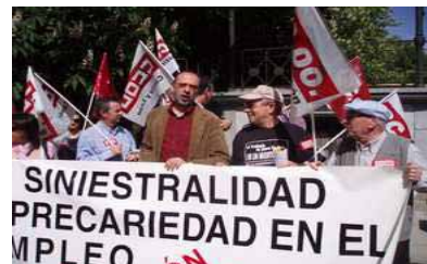
Concentración en León