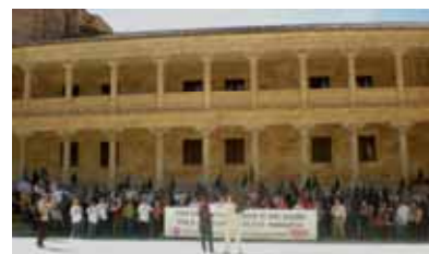
Concentración en Salamanca