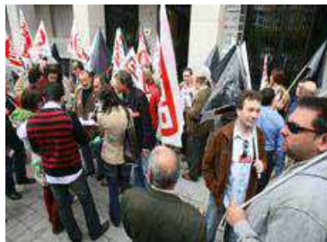
Concentración en Palencia

Bajo el lema "Que la crisis no te cueste renunciar a tus derechos" cientos de delegados de prevención y dirigentes sindicales se manifestaron ante la sede de los empresarios para recordar a todas las víctimas que pierden la vida en el lugar de trabajo.