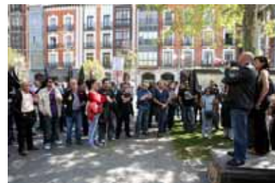
Concentración en Valladolid