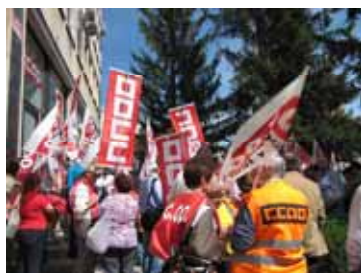
Concentración en Ávila

Las diferentes concentraciones han servido para concienciar a los empresarios de Castilla y León de lo importante que es invertir en prevención.