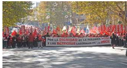
El 19 de diciembre CC.OO. promovió una manifestación en la que más de 4.000 personas pidieron en Madrid dignidad, derechos y democracia en la ONCE.

A pesar de las múltiples dificultades con las que nos encontramos, estos datos nos animan a seguir trabajando en esta dirección. Aunque todavía queda mucho por hacer, en realidad casi todo, no es menos cierto que a pasos cortos seguimos avanzando, siempre firmes, ya que nuestra convicción siempre debe de ser la de: "LA SALUD LO PRIMERO" .