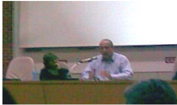
Momento en el que el Director de Istas hacía su exposición.

Por su parte, el director de ISTAS abordó las coordenadas políticas y sindicales en las que se enmarca nuestro trabajo diario.