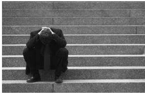
La incertidumbre en relación al mantenimiento del puesto de trabajo aumenta la ansiedad del 62% de trabajadores y trabajadoras, respecto del pasado año.

El Instituto Nacional de Seguridad e Higiene en el Trabajo presentó el día 25 de septiembre dos nuevas guías técnicas, una de las cuales ya hicimos constancia en el anterior número del Boicoot. La segunda de ellas con el título "Criterios de Calidad de Servicio" tiene como objetivo contribuir a mejorar la eficacia y calidad de las actuaciones de los servicios de prevención ajenos (SPA), en el marco de lo establecido en el objetivo 2º de la Estrategia Española de Seguridad y Salud en el Trabajo 2007-2012, en la que se contempla la elaboración de unos "criterios de calidad del servicio", no vinculantes, con los cuales se pretende no sólo establecer las ratios de recursos humanos y materiales que les son exigibles y que han sido fijadas en la ORDEN TIN/2504/2010, sino también ordenar e interrelacionar las actuaciones que debe desarrollar un SPA, precisar los requisitos legales aplicables a cada una de dichas actuaciones y establecer principios de buenas prácticas.