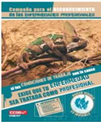
Cartel elegido por CC.OO. para hacer pública la campaña.

Un estudio llevado a cabo por ISTAS (Instituto Técnico Sindical de Ambiente y Salud de CC.OO.), que ha seguido metodologías homologadas internacionalmente para confeccionar los resultados, fija en 16.115 los trabajadores fallecidos por patologías relacionadas con su profesión. Y a pesar de tan escalofriante cifra, las estadísticas nacionales para el año 2007 no reconocen ninguna muerte por enfermedad profesional. A mayor abundamiento, en las estadísticas oficiales únicamente se recogen 15.843 EEPP, lo que supone un subregistro del 82,65% y un descenso de un 27,7% respecto al 2006.