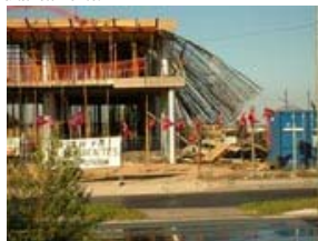
El sector de la construcción es uno de los sectores donde es más necesario el recurso preventivo.

1º. Cuando los riesgos de un proceso o actividad se puedan ver agravados o modificados por la concurrencia de operaciones diversas que se desarrollen sucesiva o simultáneamente.