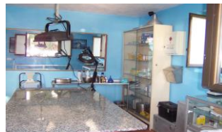
Imagen de un servicio médico de una empresa.

informe que analiza dichas actuaciones y en conclusión, ha impartido instrucciones precisas para que siempre que se compruebe la práctica del descanso preventivo, se extiendan las oportunas actas de infracción .