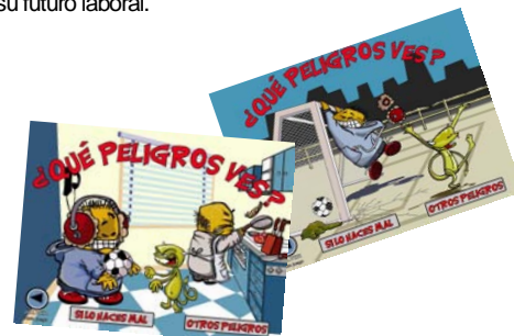
Imagen de algunas de las escenas con las que tendrán que trabajar los escolares.

“KUY DAO se reiniciará esta primavera, y se pretende llegar a más de 5.000 alumnos castellano leones”