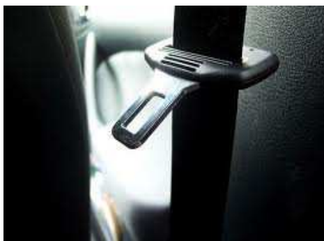
Las empresas que realicen planes de movilidad y seguridad vial podrán reducir las cotizaciones a la Seguridad Social.

Y por último también se ha aprovechado para mostrar el debate generado en torno a los conocidos "descansos preventivos", una práctica llevada a cabo por muchas empresas y que dista mucho de ser "preventiva".