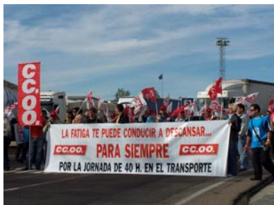
Momento en el que CC.OO. y CGTP se concentraban en el punto fronterizo de Fuentes de Oñoro.