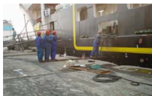
“1º Premio a la Seguridad Laboral” ...sin comentarios...”

no se encuentra apto para trabajar, deberá pedir a la Mutua que inicie el expediente, para que sean los Servicios Oficiales los que tramiten la incapacidad, si la consideran procedente y sea un Tribunal Médico cualificado el que determine si el trabajador puede seguir trabajando y en qué condiciones.