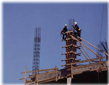
El sistema de bonus-malus forma parte de la Estrategia Española de Seguridad y Salud en el Trabajo 2007-2012, que se acordó entre el Gobierno y los agentes sociales.

"La Seguridad Social "premiará" a las empresas si rebajan el número de accidentes, pero no tendrá en cuenta sólo las cifras, sino que además valorará aspectos como tener un servicio de prevención propio sin tener la obligación de tenerlo, o pasar auditorías anualmente aunque la ley establezca tres años, teniendo en cuenta el sector y el tamaño de la empresa."