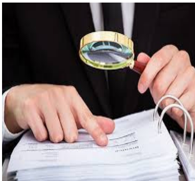
Con el programa de visitas se está intentando que las empresas integren la prevención en su seno de una forma real y eficaz, y no sólo desde el punto de vista formal.