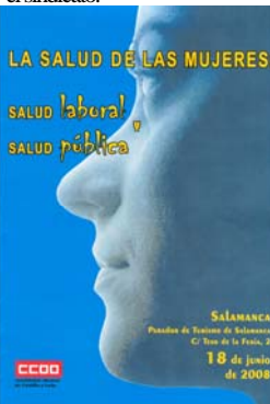
Imagen del Programa de la Jornada.

El encuentro que tratará de aportar una mirada de género en materia de salud laboral, tiene como objetivo final dar a conocer la realidad de la presencia laboral de las mujeres en las empresas, visualizando la transversalidad de género en el ámbito de la salud como uno de los ejes fundamentales de ambas Secretarías buscando mediante el trabajo conjunto el aprendizaje de nuevas fórmulas en el tratamiento de la salud de las mujeres desde el sindicato.