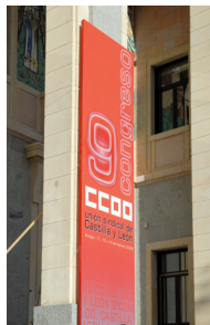
Cartel del Congreso.

Las líneas de actuación se han articulado en torno a 6 EJES estratégicos que resumen las preocupaciones del sindicato cara al futuro: calidad en el empleo, protección social, negociación colectiva, acción sindical o fortalecimiento de la presencia del sindicato en la sociedad han sido algunos de los temas guías del programa de acción de CC.OO., sin poder olvidar, claro está, la salud laboral. De la elaboración y lectura de las ponencias ha quedado patente que una de las prioridades de CC.OO. de Castilla y León va a seguir siendo la lucha contra la siniestralidad laboral.