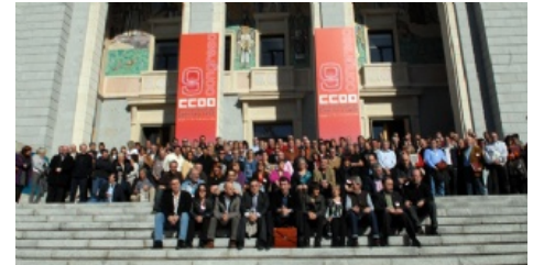
La ejecutiva y todos los delegados y delegadas ante la sede del 9º Congreso.