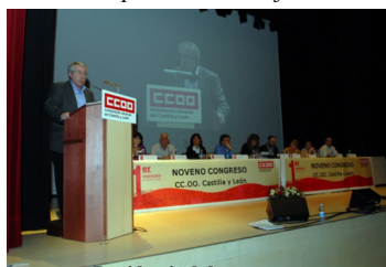
Presidencia de la mesa.