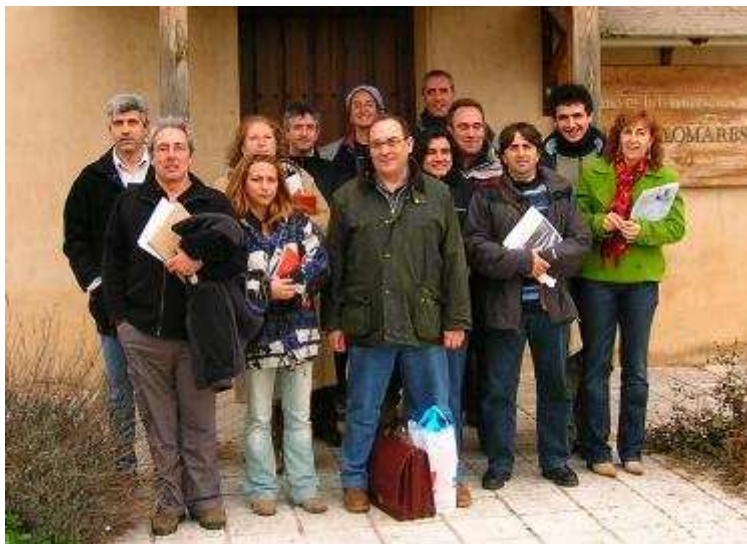
Plenario de Medio Ambiente en Villafáfila, Zamora (2007)

Agradecemos la implicación de todas las personas que han colaborado con la Secretaría desde su creación y os animamos a continuar con vuestro desempeño en este reto tan bonito de frenar la degradación ambiental del Planeta y garantizar una calidad de vida digna para sus habitantes.